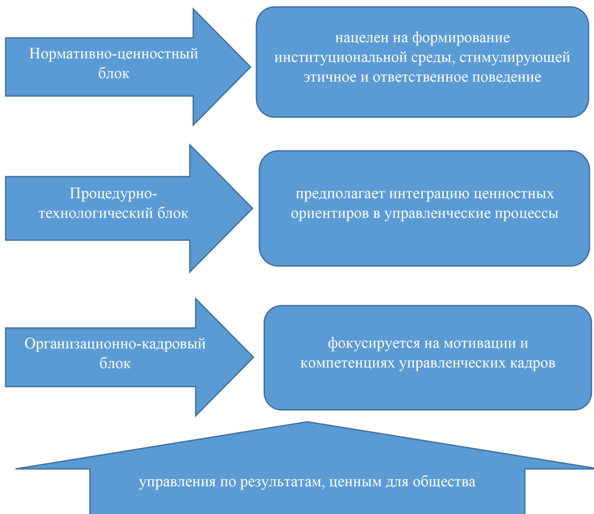
Рисунок 2. Структура модели социальной ответственности органов власти системы публичного управления [разработан автором] Figure 2. Structure of the Social Responsibility Model of Public Administration Bodies [developed by the author]

Нормативно-ценностный блок управления данной модели направлен на формирование институциональной среды, стимулирующей этическое и ответственное поведение. В его составе выделим три элемента – развитие этической инфраструктуры, внедрение института социального аудита, легитимация и защита «сигнальщиков». Этот блок представляет собой целостный механизм, в котором организационные структуры, процедуры оценки и право-